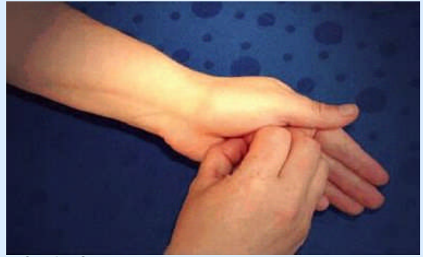
6. Schritt: Geschlossene Fingerkuppen in die rechte und linke Handfläche reiben

Typische Situationen zur Durchführung der hygienischen Händedesinfektion sind gegeben